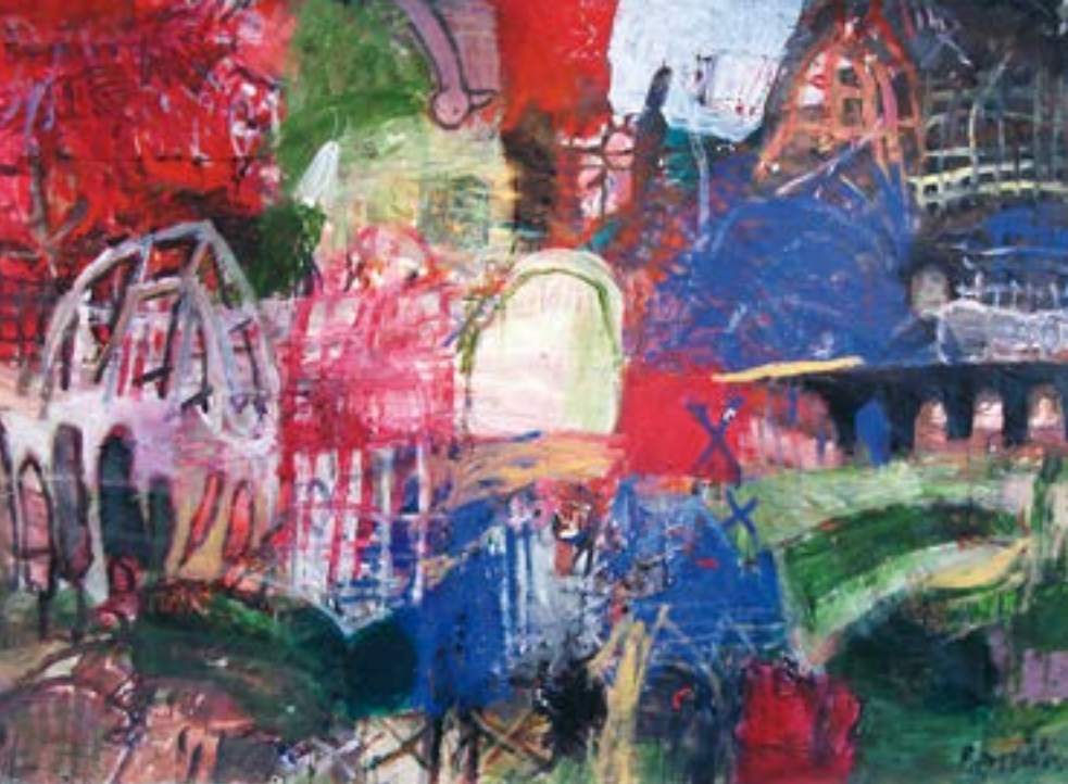
And og ansigt - 155x120 cm. - m376