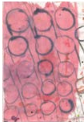
Perspektiv. Kermesfarve på papir, 40x30 cm. a549