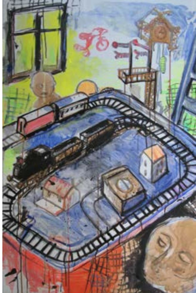
Omveje 210x120 cm. m376