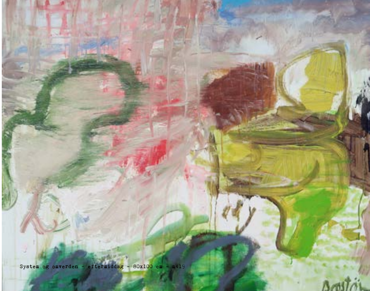
System og omverden - eftermiddag - 80x100 cm - m419